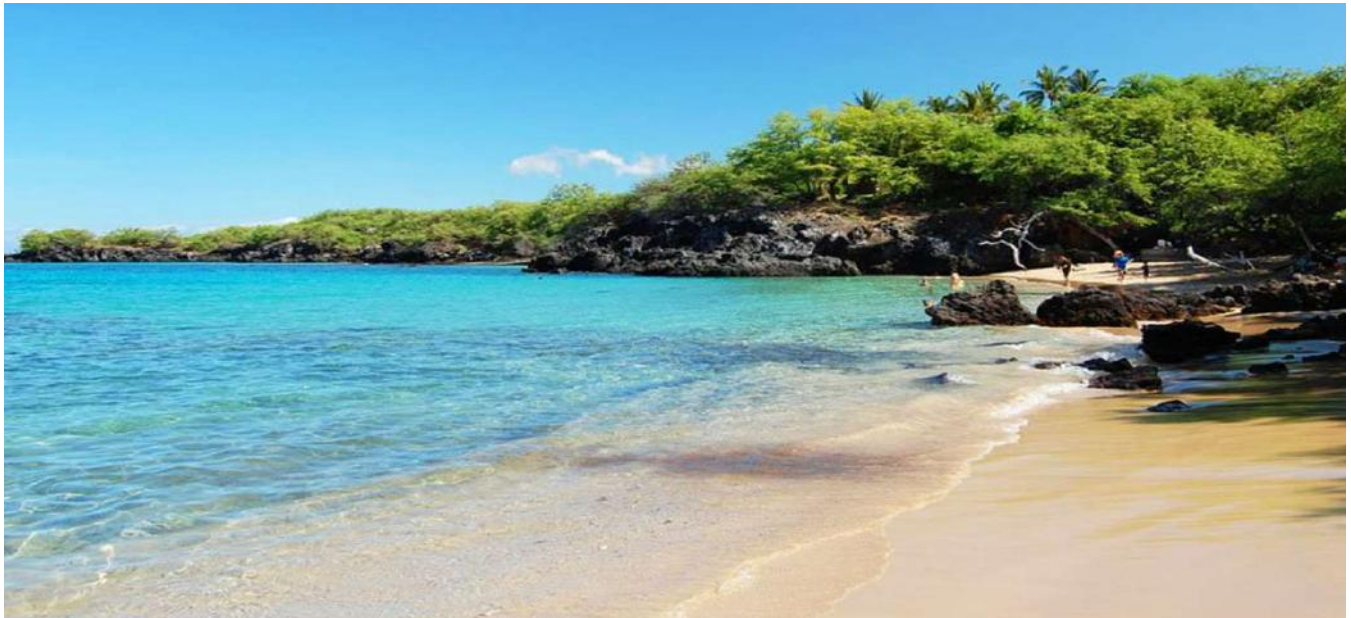
Bãi biển Waialeale nằm khuất sâu trong những tảng đá, nước biển trong veo và bãi cát trắng rất mịn màng ( vùng Kona, đảo Big Island)