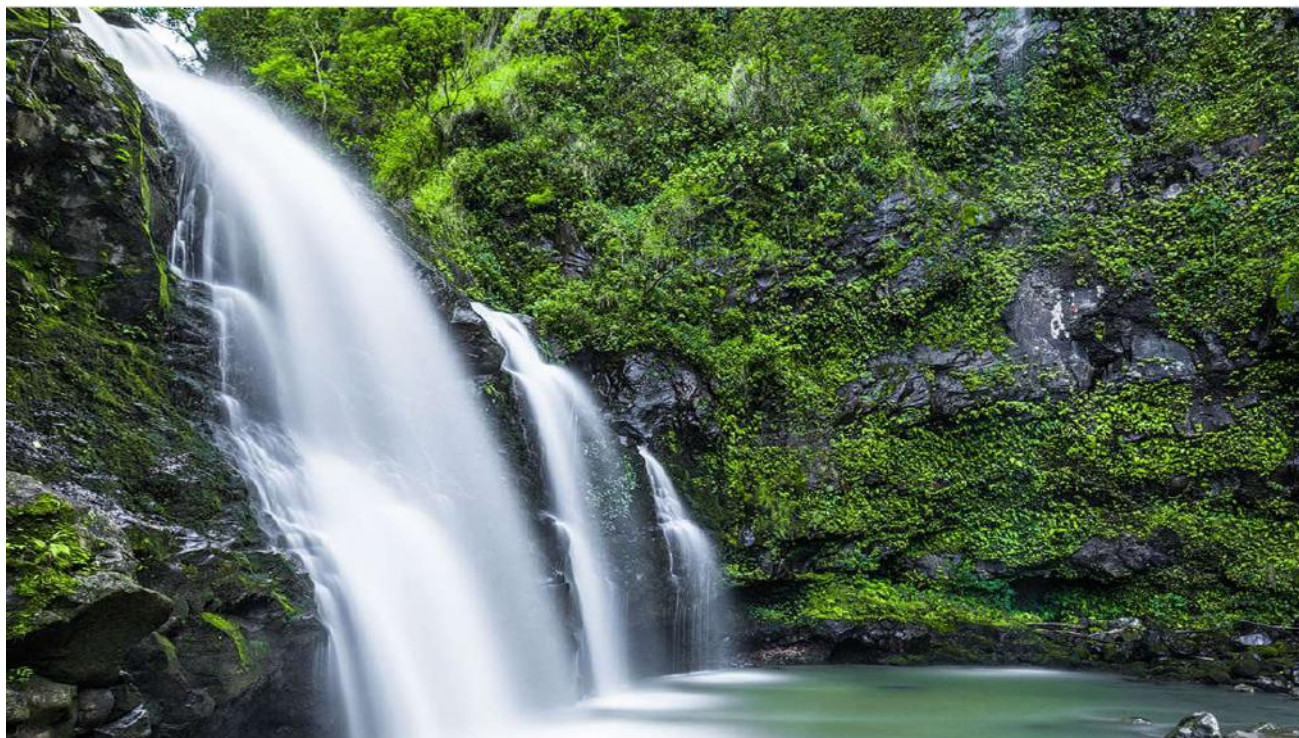
Thác nước Pua'a Kaa trên con đường Hana (đảo Maui)