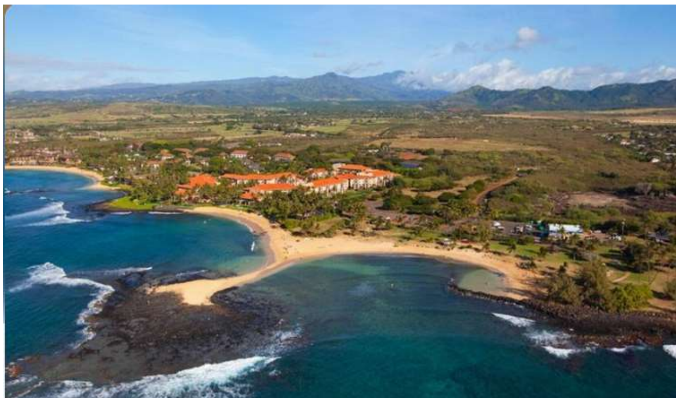
Ba bãi biển Poipu hình lưỡi liềm tạo thành ba hồ nước biển thiên nhiên (đảo Kauai)